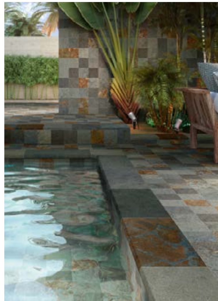
PIERRE DE BALI 15X15.ANTI-SLIP PIERRE DE BALI MIX 30X60.