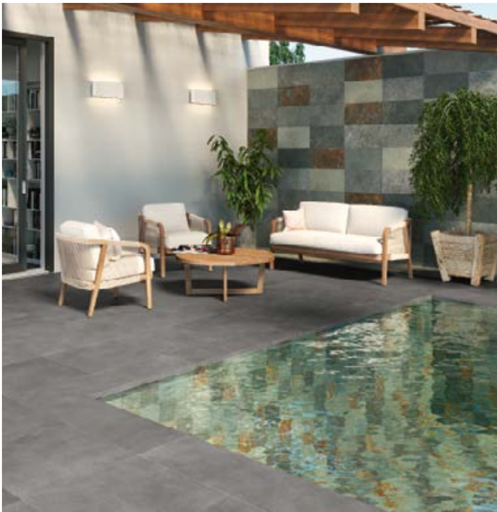
PIERRE DE BALI 15X15. PIERRE DE BALI MIX 30X60.