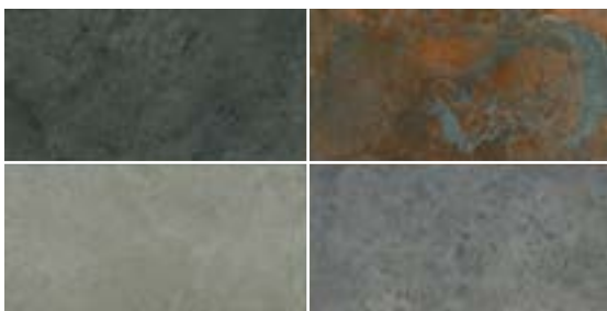
PIERRE DE BALI MIX 30X60 / 12"X24" J27/M

C3 R11 ANTI-SLIP PIERRE DE BALI MIX 30X60 / 12"X24" N79/M